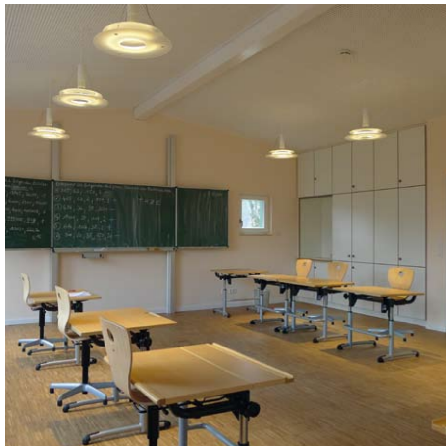
Förderschule Altes Pfarrhaus: brillantes, farbechtes Licht für lebendiges, waches Lernen