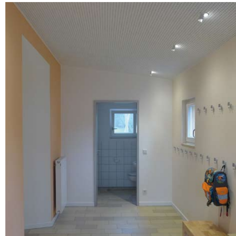
LED-Wandfluter erzeugen ein breites Lichtbild auf der Wand