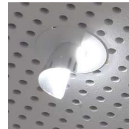
LED-Wandfluter als Deckeneinbauleuchte