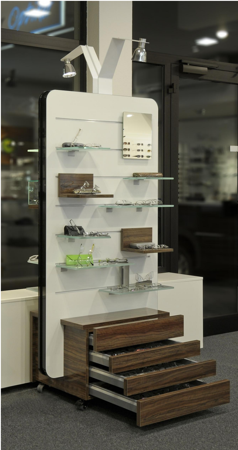
Der CHANGE IT Fensterpresenter lässt sich individuell gestalten und bestücken: vom Dekor, über die Präsentationselemente, bis hin zu den Schubläden.