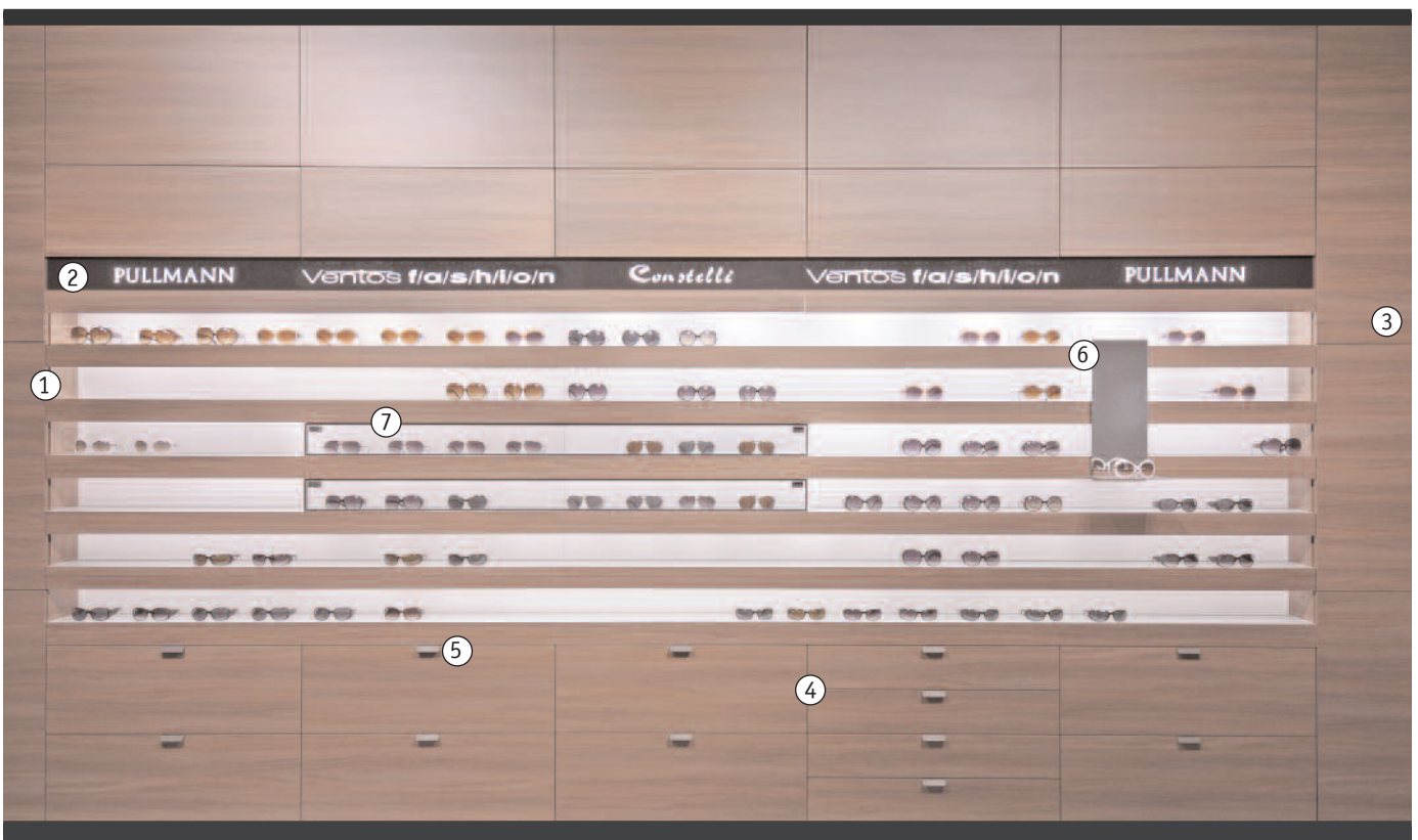
HW1 - Horizontale Wandpräsentation mit hinterleuchteter Logoblende

Auf Wunsch werden die Vitrinen und auch Schubladen- und Türelemente in dem Möbel so ausgeführt, dass sie per Transponder Fernbedienung gemeinsam geöffnet werden können. Das Verriegeln geschieht automatisch, wenn die Elemente per Hand geschlossen werden.