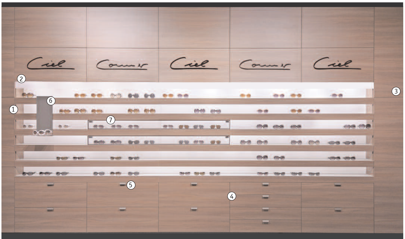
HW2 - Horizontale Wandpräsentation mit aufgesetzten Acrylglasbuchstaben